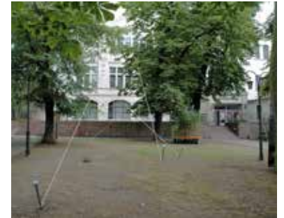
“Hart ringen gewaltige Kräfte miteinander”, 2007 (Stahl, Farbe, Haken, Seil, Grösse variabel), Volkspark, Halle/Saale