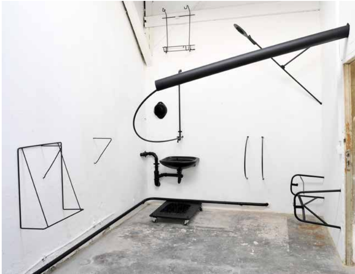
“Ohne Titel” 2009 (Rauminstallation; Objekte aus Fundstücken, Masse variabel), Abrisshaus, Berlin