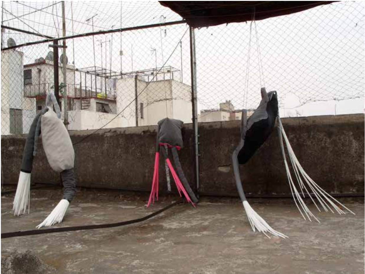
“Chilangos”, 2008, (Stoff, Schaumstoff, Trinkhalm, Faden 90 x 70 x 35 cm) Hausdach privat, Mexiko Stadt