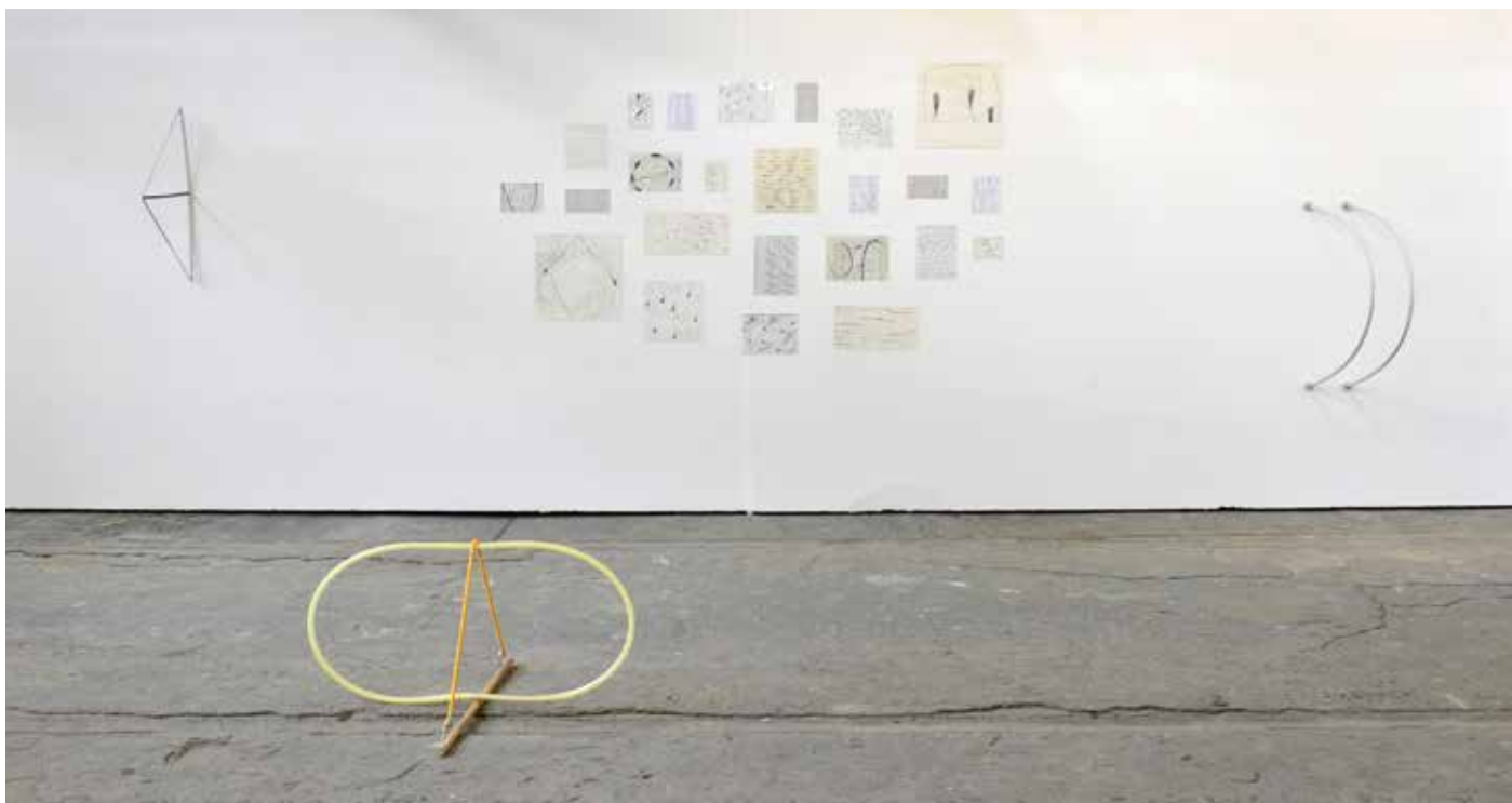
“Ohne Titel” 2011 (Rauminstallation; Objekte aus Fundstücken und Zeichnungen, Masse variabel) “Diplom und Meisterschülerausstellung”, Berlin