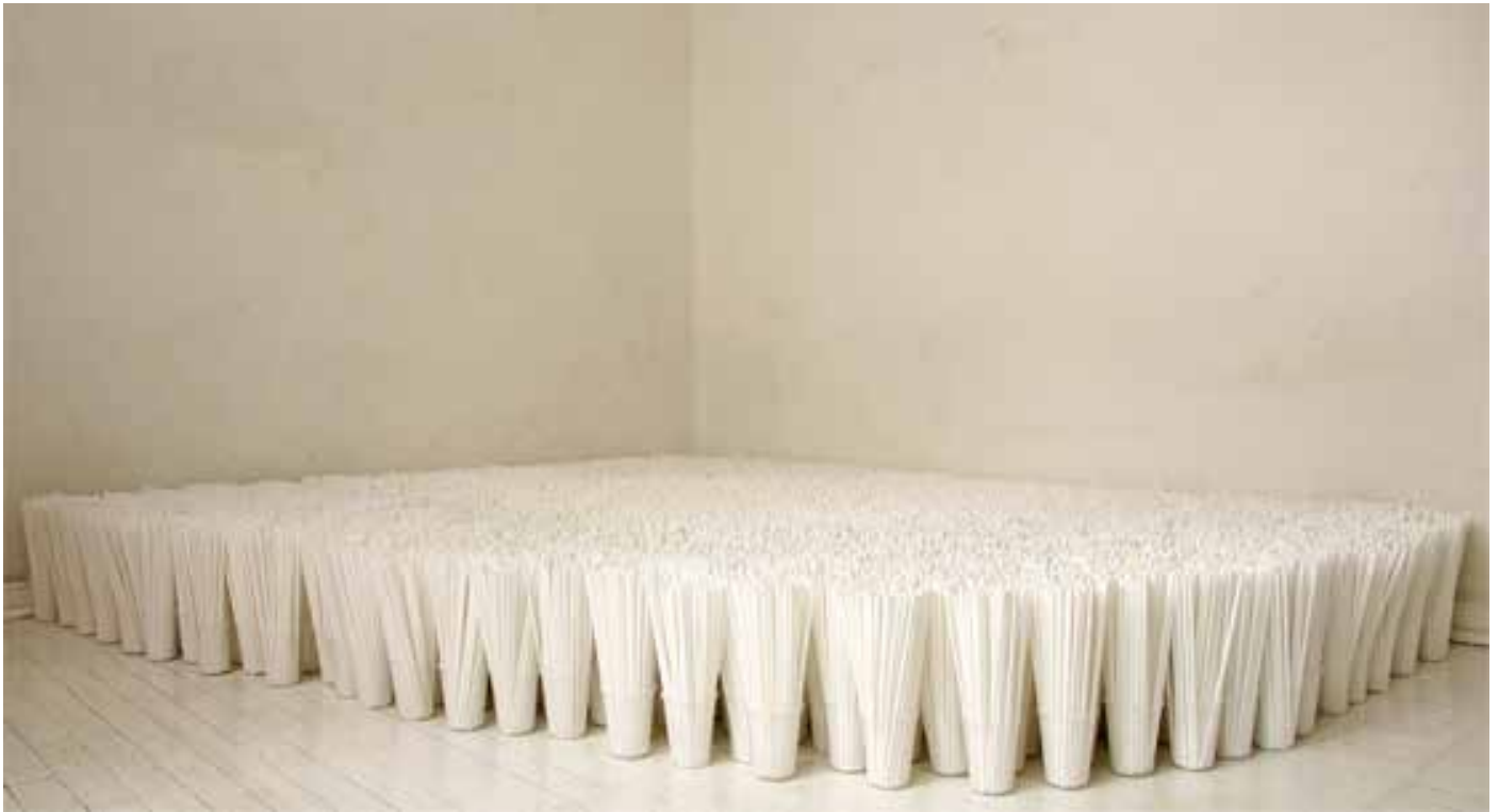
“Ohne Titel”, 2008 (Trinkhalme, Plastikbecher, Größe variabel), Schlafzimmer, Mexiko Stadt