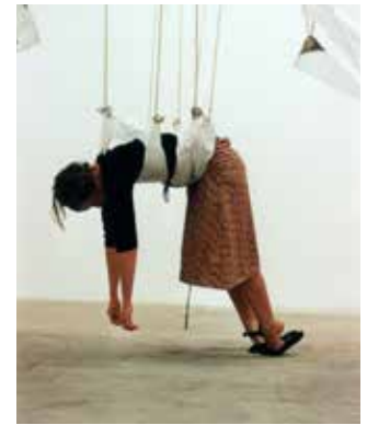
“Ohne Titel”, 2007 (Plane, Ösen, Haken, Seil, 600 x 60 x 70 cm), Alte Baumwollspinnerei, Leipzig