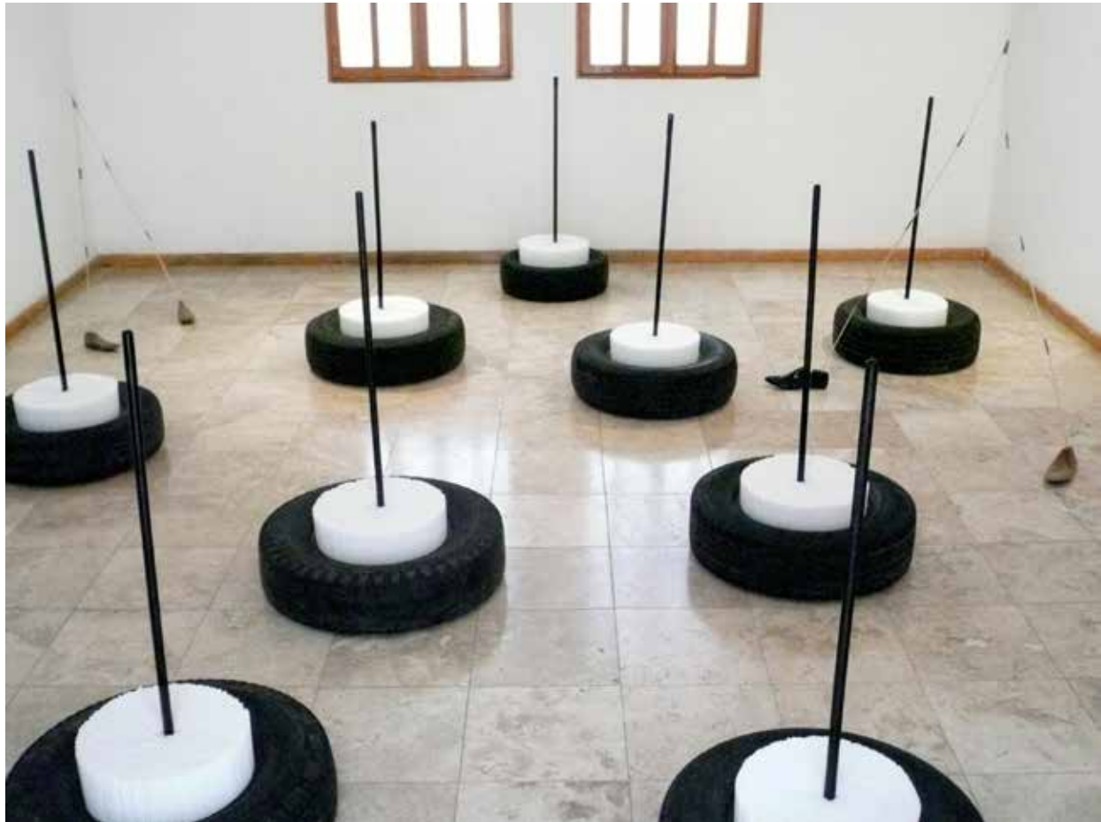
“Ohne Titel”, 2008 (Autoreifen, Trinkhalm, Holzstab, Schuhe, Farbe, Größe variabel), Centro Cultural Casa Frisac, Mexiko Stadt