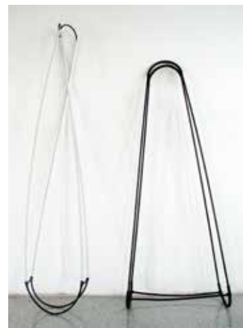
“Ohne Titel”, 2007 (mixed media, Masse variabel), Atelier, Halle/Saale