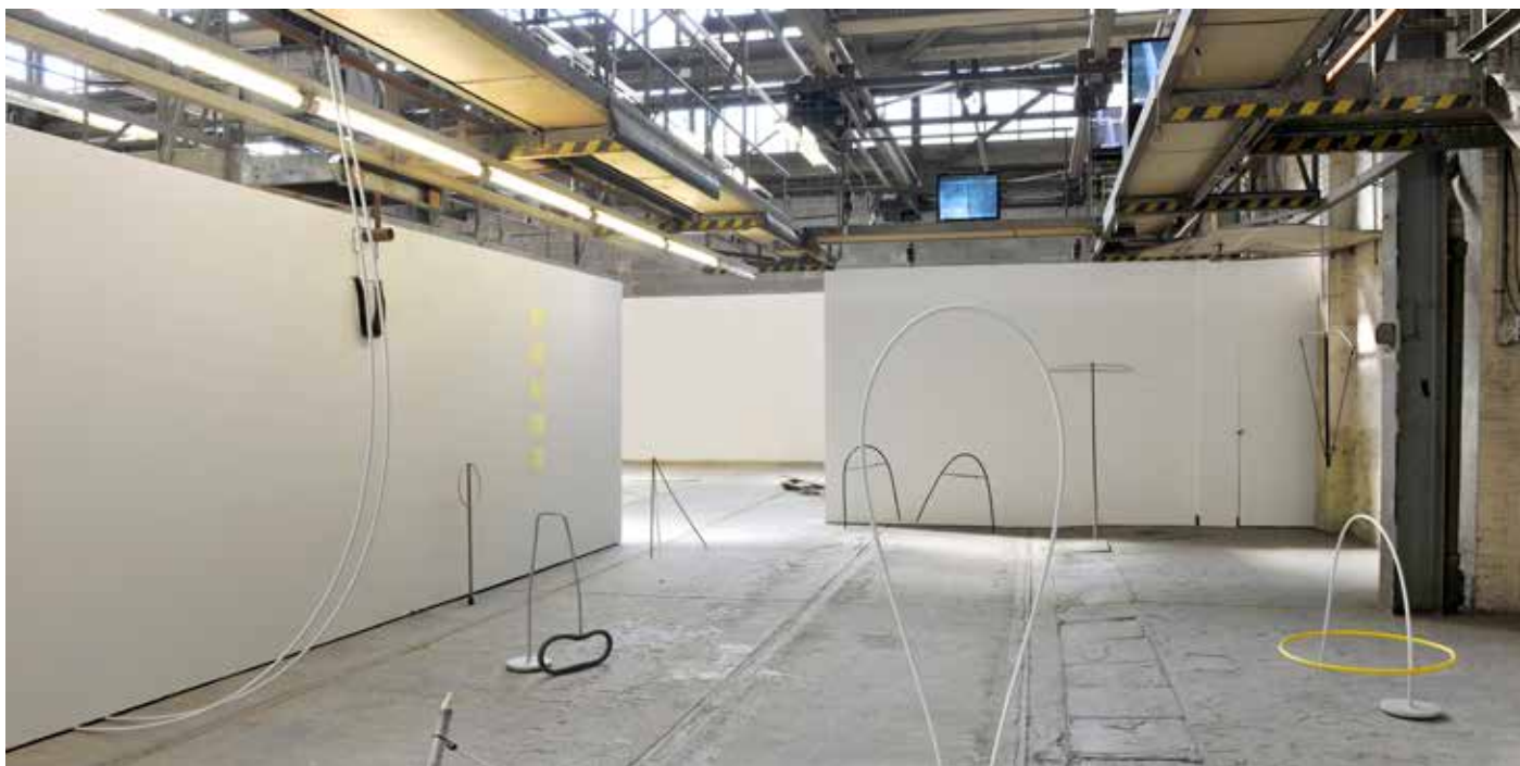
“Ohne Titel” 2011 (Rauminstallation; Objekte aus Fundstücken und Zeichnungen, Masse variabel), “Diplom und Meisterschülerausstellung”, Berlin