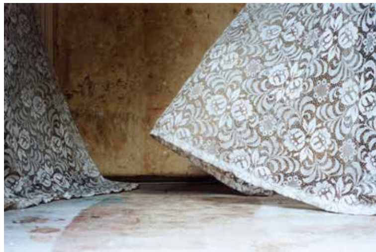
“Ohne Titel”, 2007 (Gardine, Ventilator, Zeitschaltuhr), Altes Haus, Halle/Saale