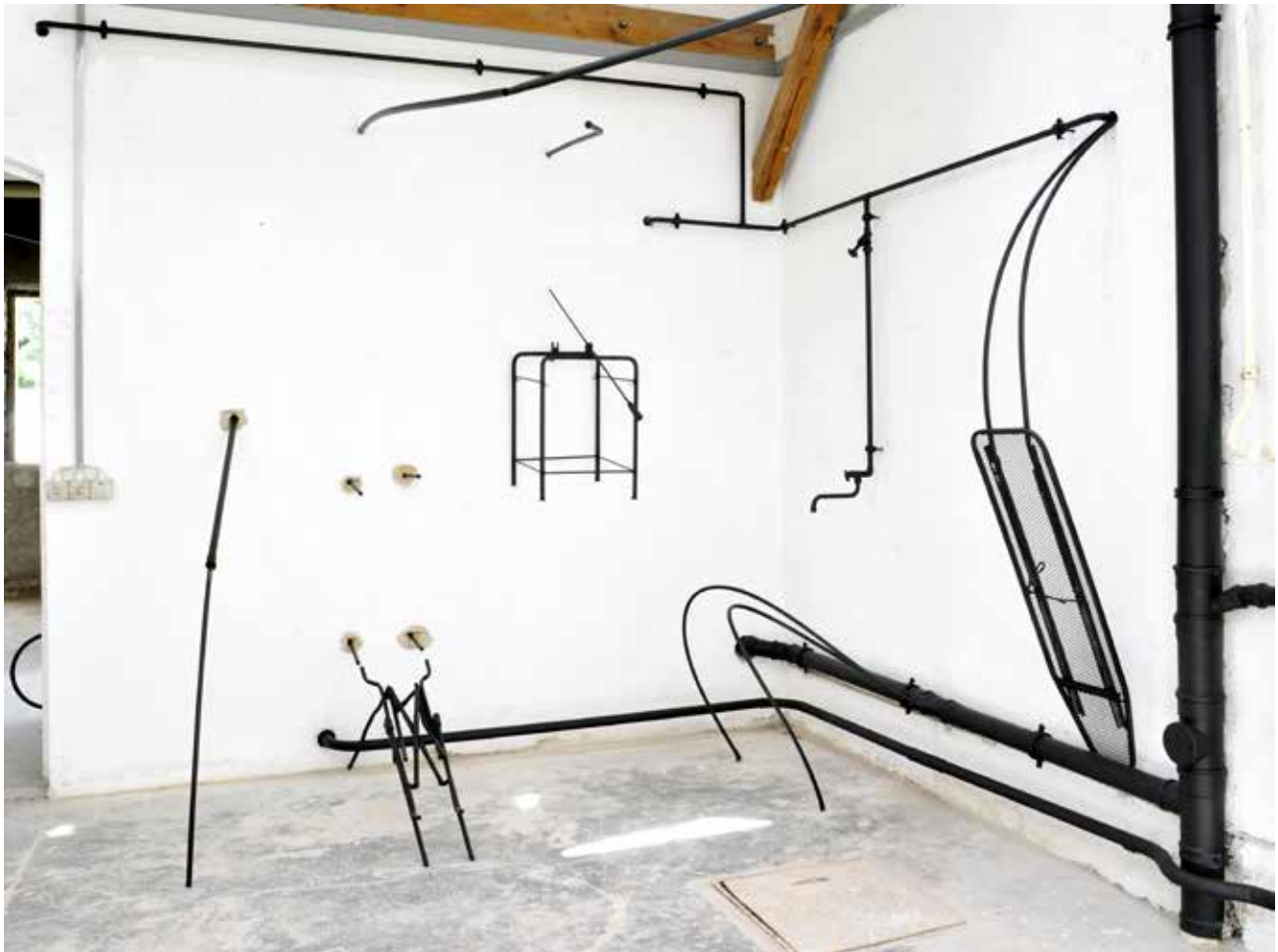
“Ohne Titel” 2009 (Rauminstallation; Objekte aus Fundstücken, Masse variabel), Abrisshaus, Berlin