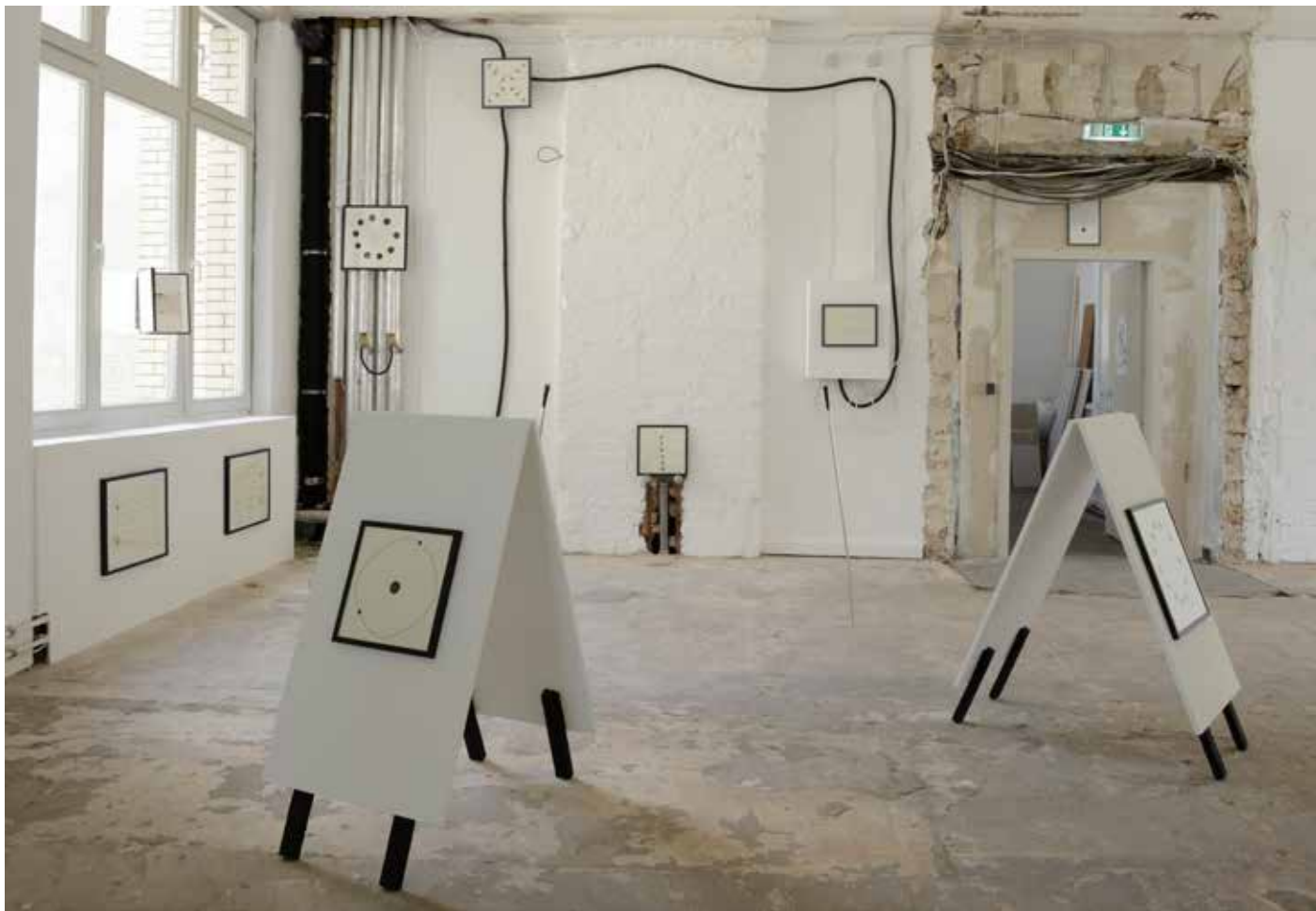
“Ohne Titel”, 2012 (Rauminstallation mit Fundstücken und Zeichnungen, Masse variabel), “Freitag der Dreizehnte”, Berlin