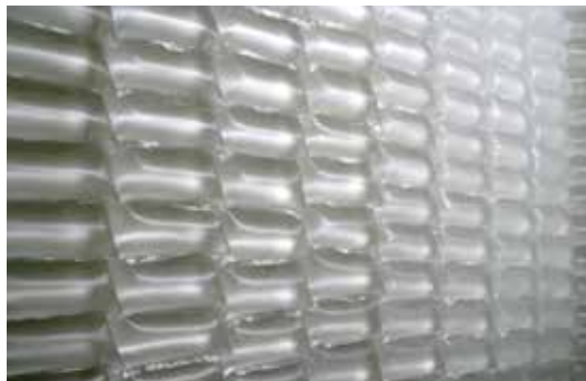
“Top Braun”, 2006 (Plastikbeutel, Wasser, Nadel), Abrisshaus, Halle/Saale