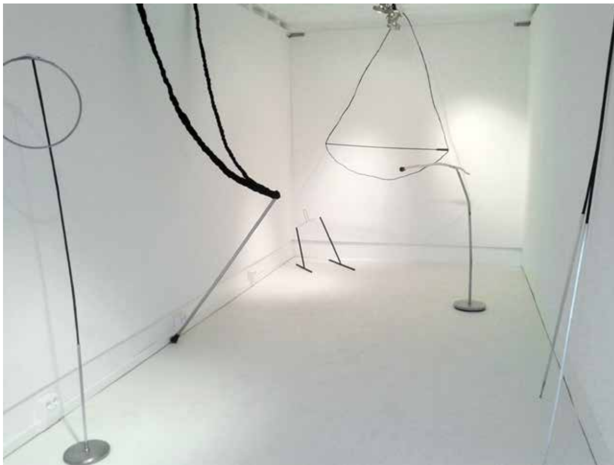
“Ohne Titel”, 2014 (Installation mit Objekten aus Fundstücken in Container), “Art Truck”, Berlin