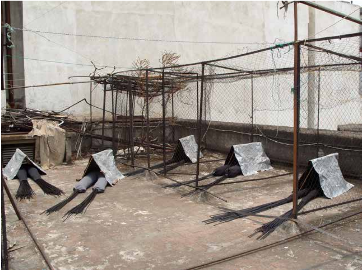
“Despazados”, 2008 (Plane, Holzstab, Stoff, Schaumstoff, Trinkhalm, 55 x 190 x 60 cm), Hausdach privat, Mexiko Stadt